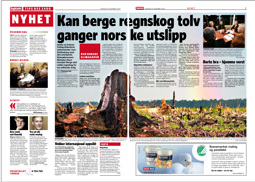
Figur 3.1: Kan berge regnskog tolv ganger norske utslipp, 10.12.07

skisserer dermed ingressen hva artikkelen skal handle om. Overskriften Kan berge regnskog tolv ganger norske utslipp sier for eksempel ingenting om hvem som kan gjøre dette, men ingressen forklarer oss at dette dreier seg om hvordan Norge skal redde regnskog for tre milliarder årlig.